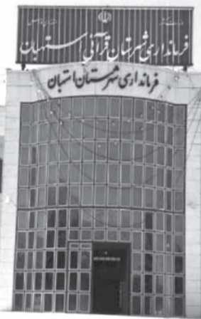
روابط عمومی فرمانداری استهبان